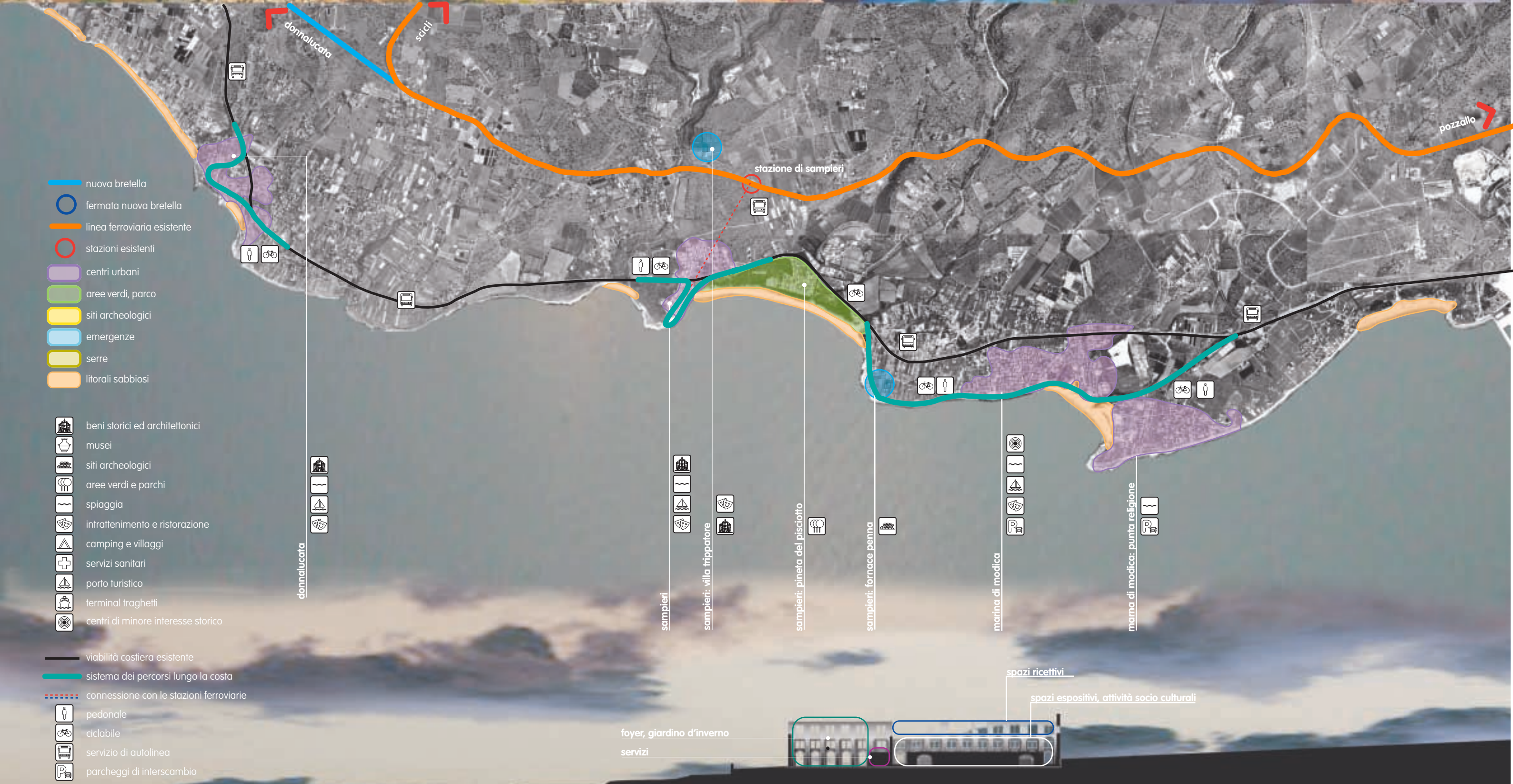
fornace penna sezione sull'asse longitudinale; layout funzionale scala 1:1000